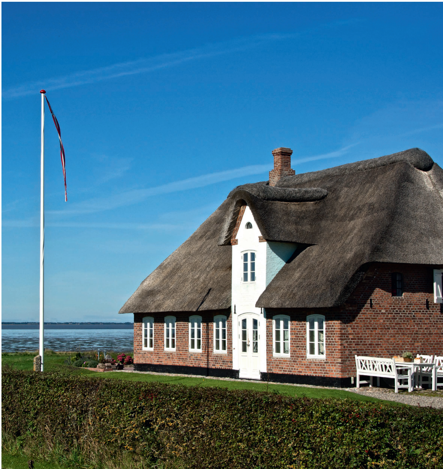
18303 - Grafisk Service, Region Syddanmark - 11.2023