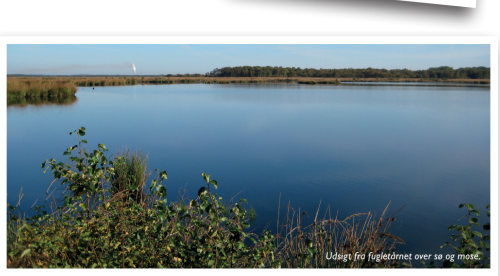
Udsigt fra fugletårnet over sø og mose.

Der er anlagt vandrestier i både skoven og mosen. Ved Teltkrovej er der desuden opstillet et fugletårn til iagttagelse af fugle, bl.a. lappedykkere, ænder og vadefugle. Af hensyn til fuglens yngletid, er det ikke tilladt at færdes i mosen fra 1. marts til 1. juli. Ture i området kan startes fra P-pladsen i Draved Skov.