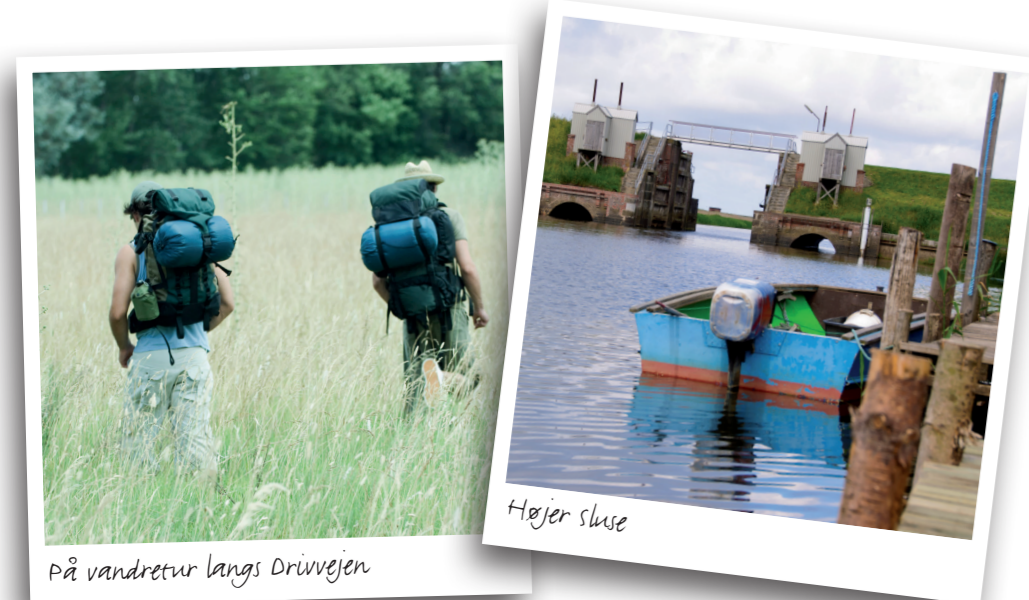
På vandrerur langs Drivvejen.

Du kan læse mere på www.klosterruten.dk .