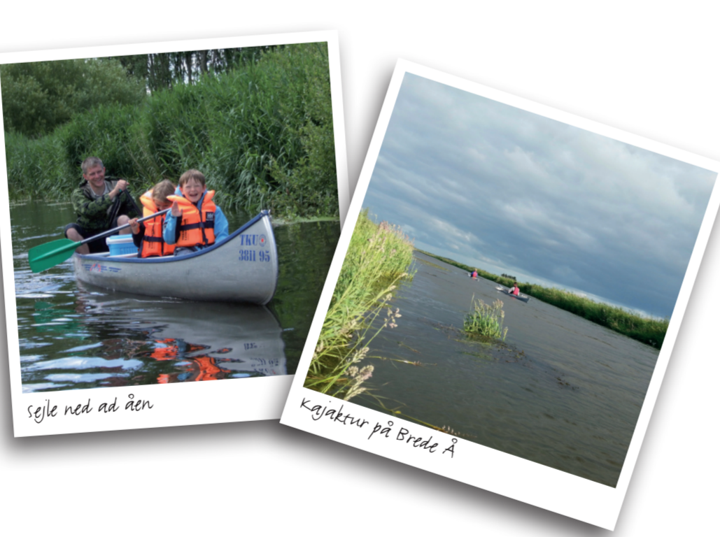
Sejle ned af åen

At sejle i kano eller kajak er en aktiv, men samtidig afslappende ferieform. Mens du padler af sted, kommer du helt tæt på det varierede og smukke landskab. Flere steder langs sejlsjands­­vand­løbene findes primitive overnatnings­pladser – her kan du slå dit eget telt op eller gå i land for at spise din mad samt holde en pause fra sejlsjaden. Læs mere i folderen ”Sejle ned af åen i Sønderjylland”, som beskriver forskellige sejlsjruter.